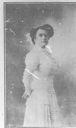
ORTA BIDIANA CORCUA