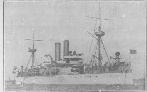
El "Maine" en la Habana