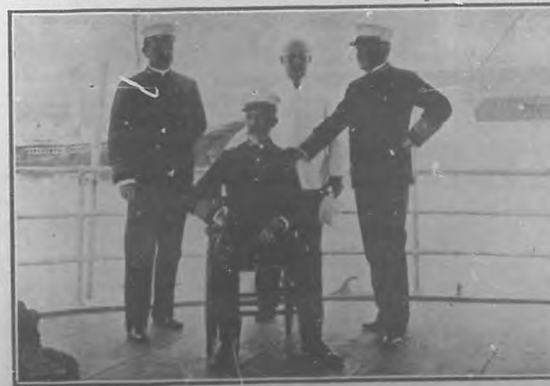
Comisión naval americana á bordo del "Mangrove", que informó por encargo de su gobierno acerca de las causas de la explosión del "Maine"