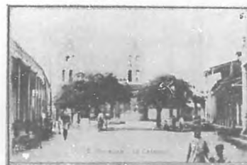
5. Iglesia y Parque de Baracoa

En los estrechos límites de una rápida información no podemos dar, con harta sentimiento, cabida á otros elementos respetables que en Baracoa y por Baracoa laboran. Pero les llegará el turno. BOHEMIA no se limitará á una sola excursión por las principales poblaciones de la república. En otras recogerá impresiones dignas de estampar en sus páginas siempre abiertas para todo lo notable, en cualquier orden que sea, que Cuba encierra de Maisá á San Antonio.