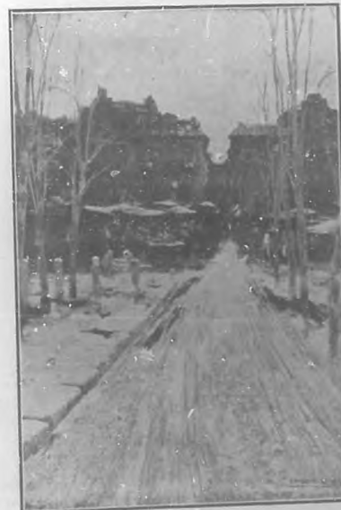
Calle vieja (Italia)