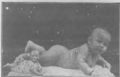
AGUSTIN SABELLO BRENQUER

Dedico mi más afectuosa felicitación á tan simpática pareja, deseando poder consignar cuanto antes la fecha de su boda.