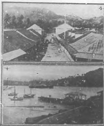
3 Calle de la Playa. 4 Vista del puerto y muelle público.

Echemos una rápida ojeada á la Baracoa actual.