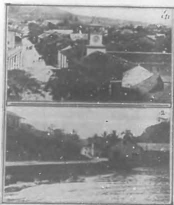
1 Vista de la calle Real y Ayuntamiento. 2 Calle de la Marina (baja).

Recorramoslos y hagámonos cargo de lo que es actualmente Baracoa, atravesando calles como la Real, contemplando el Ayuntamiento, siguiendo las calles Marina, Playa, el puerto y su muelle, la Iglesia y el Parque, el Puente de la Posada.... Con esto nos daremos grá-