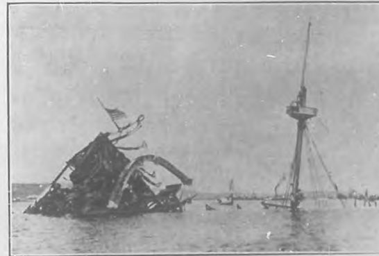
Restos del "Maine"