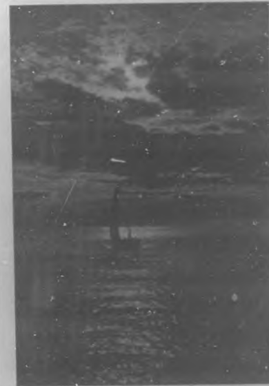
Noche de luna