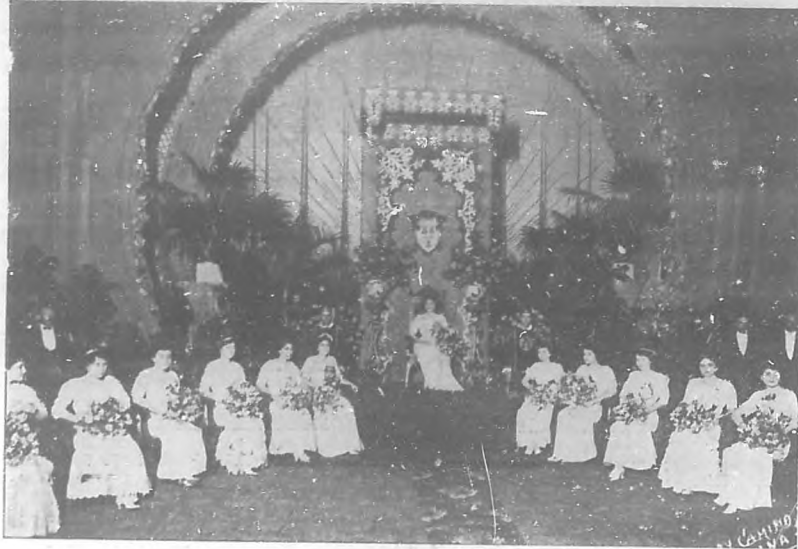
La Reina y Corte de Amor

Gráficamente hemos querido recoger en nuestras páginas el acto simpático y solemne de la coronación del poeta español Salvador Rueda. En dicho acto las primeras autoridades, nutrida representación de la belleza cubana, la colonia española y elementos intelectuales así españoles como cubanos, se unieron para festejar al prin-