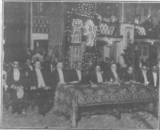
La Mesa Presidencial

El Vice Presidente de la República, Dr. Alfredo Zayas, pronunció un brillante discurso se leyeron, además, la poesía "Len-