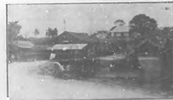
6. Vista del Puente de la Posada